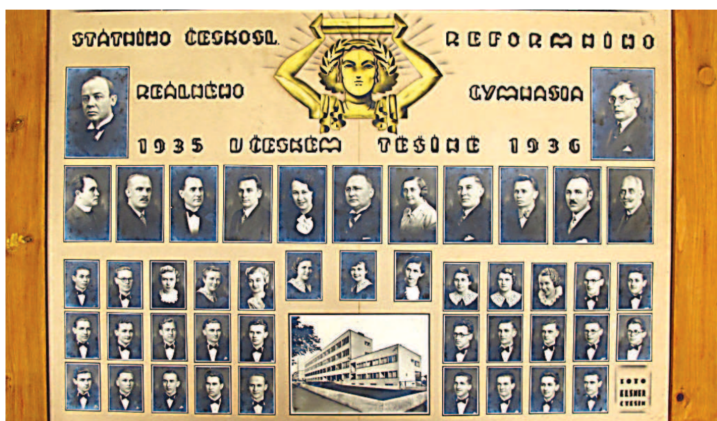
V roce 1936 byla pro studenty nezbytností vázanka nebo motýlek.