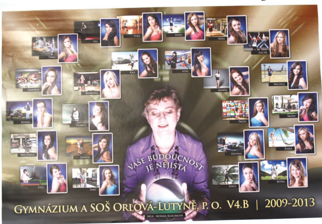
Orlovští maturanti mají o své budoucnosti jasno.