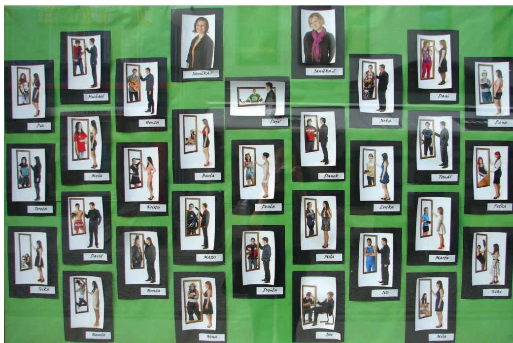
Bohumínští maturanti vsadili na své alter ego.

To maturanti z Gymnázia F. Živného v Bohumíně zažili při tvorbě svého tabla, které nyní visí výloze obchodu s domácími potřebami na třídě Dr. E. Beneše, poněkud krušnější chvíle. „Focení bylo celkem katastrofa, natře-