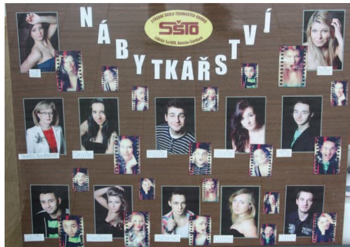
Maturanti oboru nábytkářství razí heslo, že v jednoduchosti je krása.