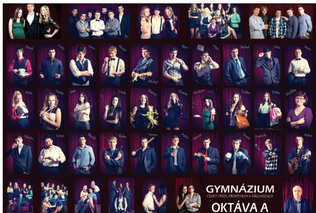
Těšínští studenti nechali promluvit své osobnosti.

Naprostým protikladem je pak tablo z roku 1936. Studenti zde jsou vyfoceni ve stejných nebo podobných pozicích v klasickém oblečení, muži s vázankou nebo motýlkem. „Uprostřed tabla je fotografie školy krátce po dostavbě. Přístavek v popředí sloužil jako byt ředitele školy,“ informoval profesor Gymnázia Český Těšín Václav Labaj.