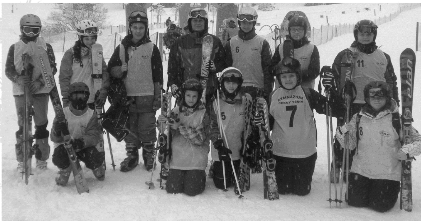
Lyžařský výcvikový kurz tříd 1. A a 5. QA

Autor článku se devět let závodně věnoval sjezdovému lyžování.