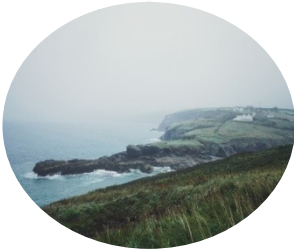
Zelená země, Irsko – 5