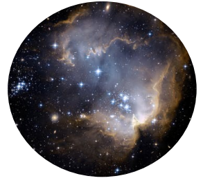
Až zavládnou rozpory – 19