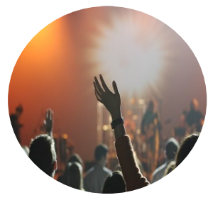
Letní festivaly – 24