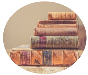
Jazyky a svět – 10