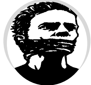
Přiznání GMCT – 15