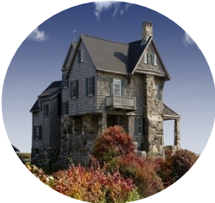
Nejzajímavější obydlí světa – 20