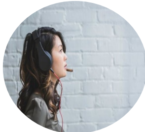
Lisztwan a jeho TOP5 – 17