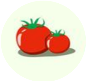
Recepty k tabuli: Džem – 16